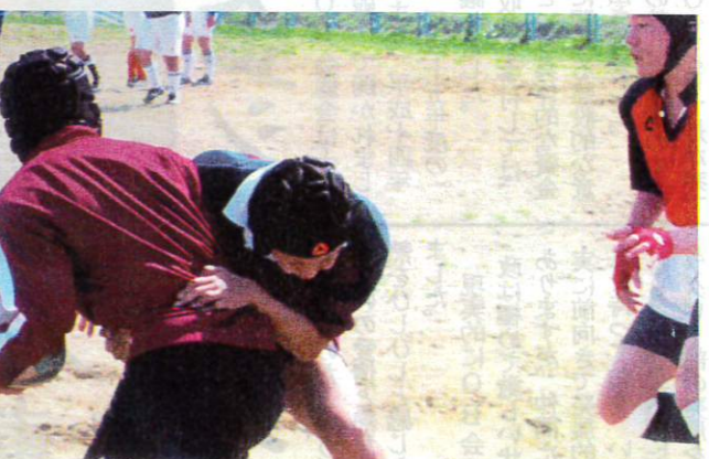
ボールを奪い合って互いに譲らぬ押し合い