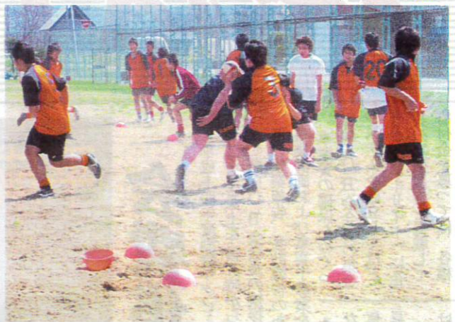
闘士たちの激しいぶつかり合いが続く