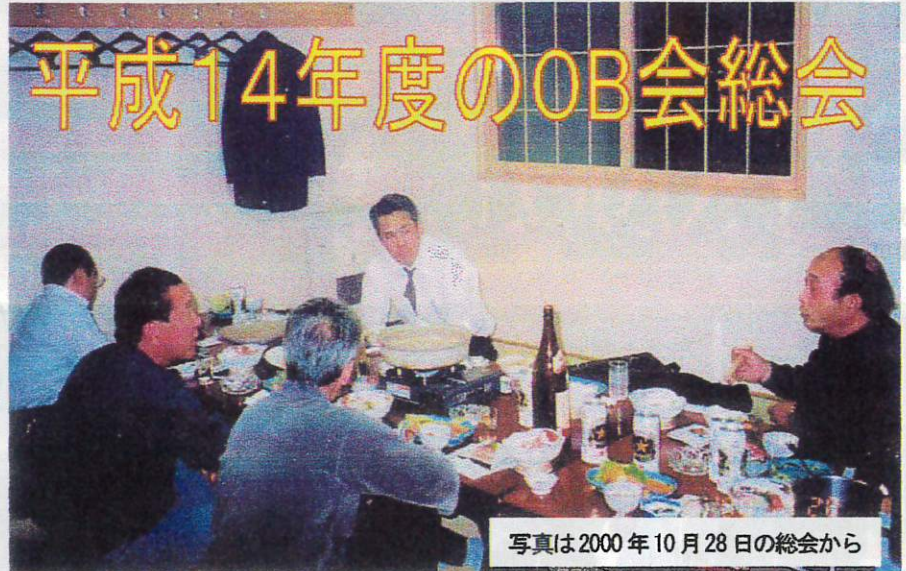
写真は2000年10月28日の総会から

そんな感動を与えてくれ た生徒たちも卒業してOB となり、今後はOB会の 一員として後輩のために惜 しまぬ支援をしてくれると 信じています。 潮陵ラグビー部発展のため、 夢の花園出場のため、 可愛い後輩のためにみんな で力を合わせ潮陵高校ラグ ビー部OB会を盛り上げ ていきましょう。