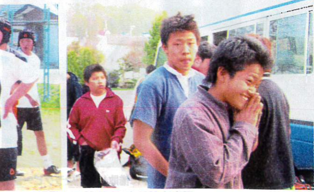
一喜一憂・戦況を見守る