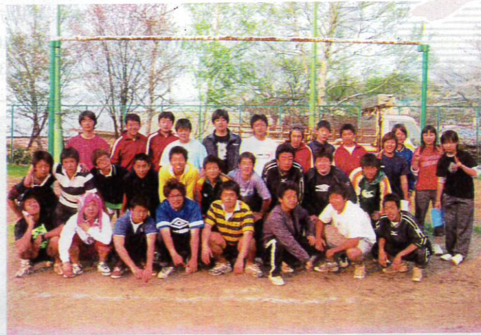
ファイトの塊みたいな潮陵の戦士たち