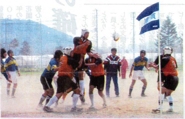
ボールを求めて群がる戦士たち