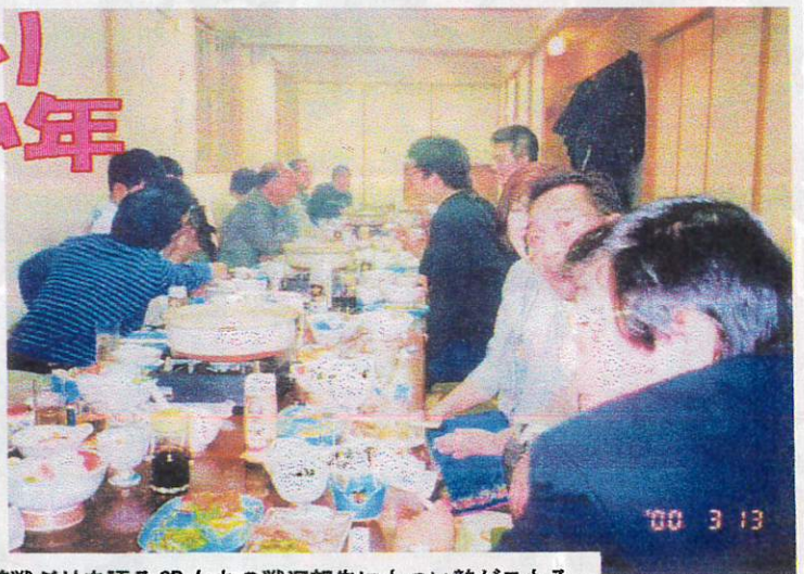
札幌山の手高校を相手に惜敗した潮陵ラグビー部の善戦ぶりを語るOBたちの戦況報告にもつい熱がこもる