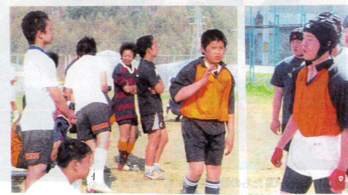
出番遅しと待機する選手たち