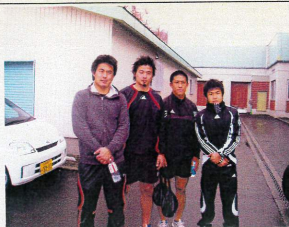
小樽潮陵高校体育館前にて